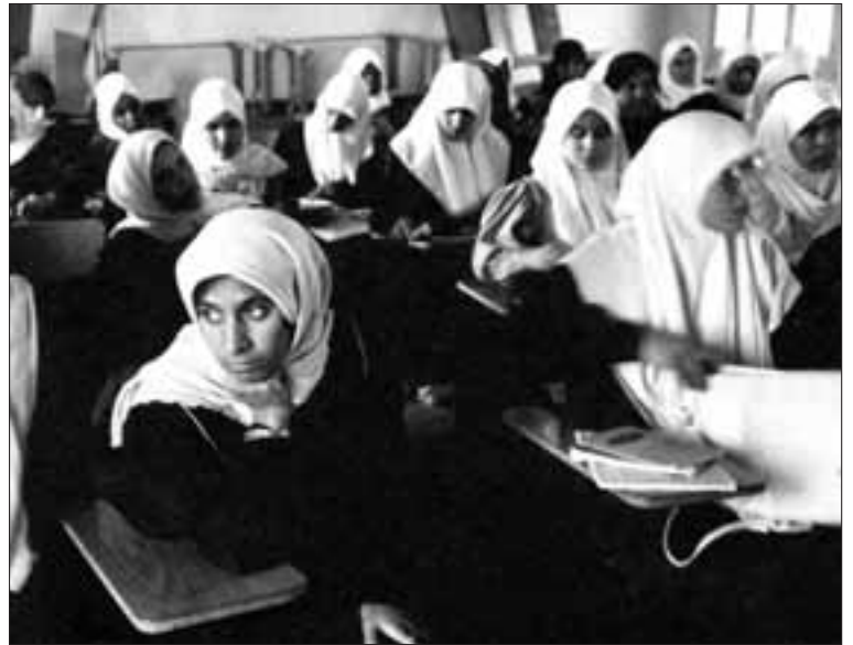
Koranschule in Mitteleuropa.

Vers 62 der 2. Sure ‘Die Kuh’ lautet: «Diejenigen, die geglaubt haben, und diejenigen, die Juden waren, und die Christen und die Sabier – wer an Allah geglaubt hat und an den Letzten Tag und Rechtsschaffenes getan hat, so ist es für sie ihre Belohnung bei ihrem Herrn und keine Furcht auf ihnen, und sie sind nicht traurig.» Dieser Vers wurde mit der später offenbarten Sure 9,5 aufgehoben: «Und wenn die heiligen Monate verstrichen sind, so tötet die Mitgöttergebenden (Götzendienen), wo ihr sie findet, und ergreift sie und belagert sie und lauert ihnen in jedem Hinterhalt auf, und wenn sie reuig