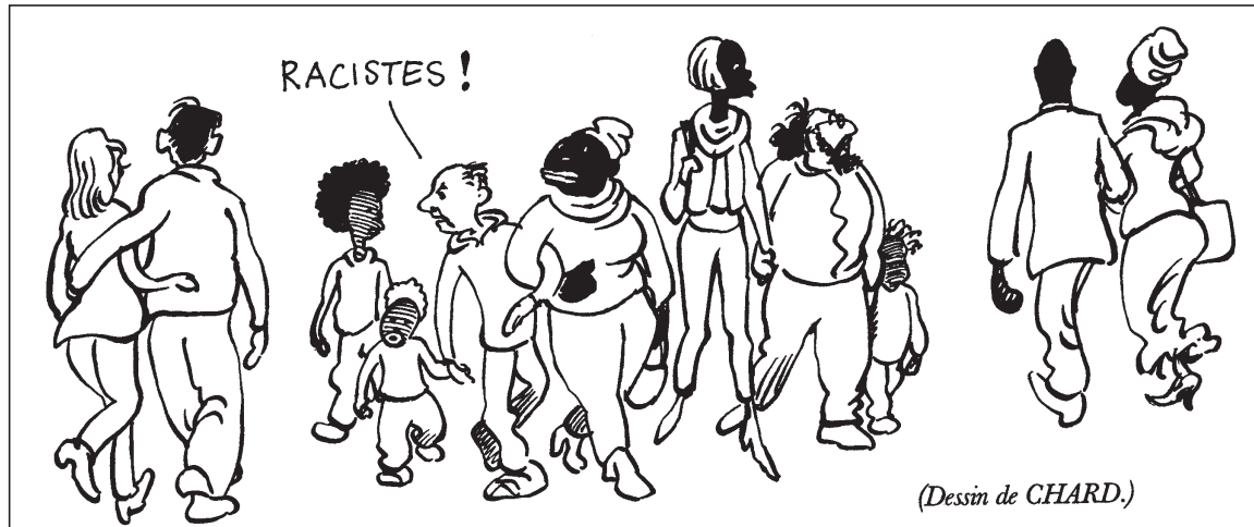
(Dessin de CHARD.)