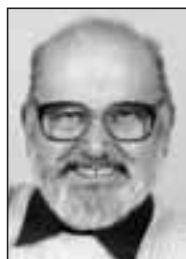
e. Nationalrat Valentin J. Oehen, Köniz

Der Monatskommentar von e. Nationalrat Valentin J. Oehen