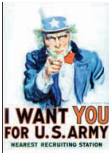
Werbeplakat des amerikanischen Heeres.

Angesichts der Brutalität, mit welcher Israel – immer mit dem Segen und der Waffenunterstützung der USA – den Süden Libanons zerstört, Hunderte von Menschen umbringt, Hunderttausende Unschuldiger zu Flüchtlingen macht, die Notversorgung der Verwundeten und Flüchtigen verunmöglicht und der Umwelt schwersten Schaden zufügt, war und ist die Aussage von Calmy-Rey nicht mehr als ein «sanftes Flüstern». Aber schon dies scheint den Repräsentanten der bürgerlichen Regierungsparteien zuviel zu sein. Es könnte ja Reaktionen, Repressionen geben von Seiten Israels und vor allem der USA. Und darum will der Bundesrat trotz aller Verbrechen des