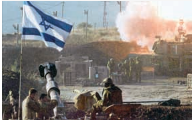
Unverhältnismässiges Vorgehen gegen die Zivilbevölkerung? Israelische M-109-Geschützatterie: 155-Millimeter-Panzerhaubitzen in der Feuerstellung.

Judenstaates mit Israel «business as usual» betreiben und nicht einmal den Bezug von Rüstungsgütern sistieren.