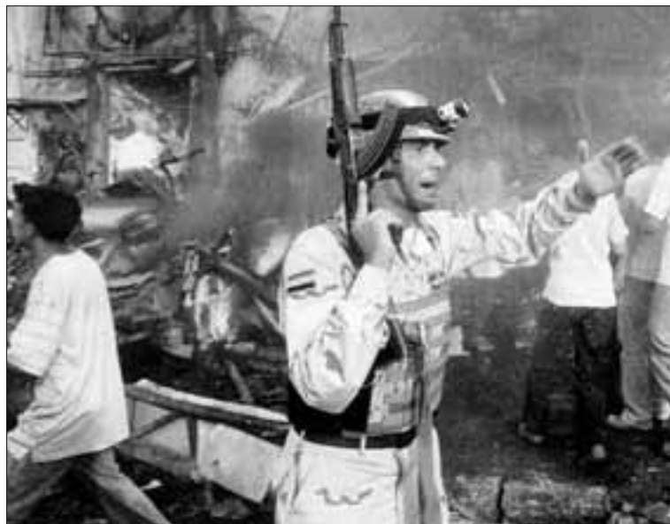
Soldat américain à Bagdad en 2006.

Je pourrais citer des dizaines d'événements tragiques provoqués dans l'unique but d'excuser des mesures impopulaires toujours édictées au