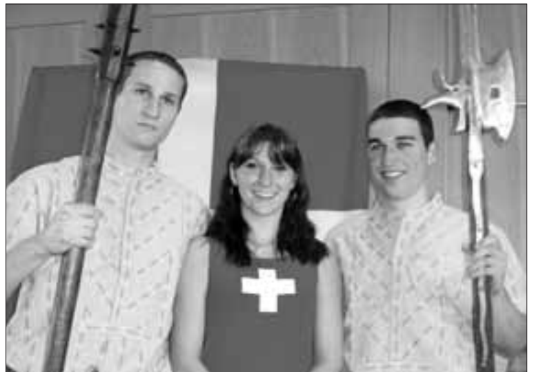
Dank an die SD Fricktal für die hervorragende Organisation.

In diesem Sinne wünsche ich Ihnen einen besinnlichen 1. August.