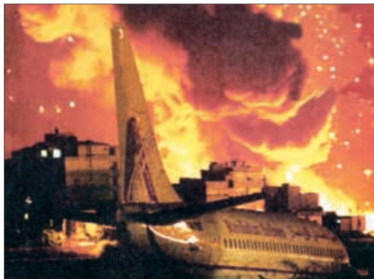
Beirut in Flammen – getroffen ist der Hariri-Flughafen mit seinen Pisten. Droht der Dritte Weltkrieg?

Interessierten Lesern empfehle ich, zur Illustration des soeben Gesagten die Liste der UNO-Resolutionen seit 1978 zu lesen, die durch die USA (als Veto-Macht), unterstützt durch Israel, oft auch GB und gelegentlich noch durch andere Staaten wie Frankreich